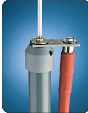
Bild 4: Ist es nicht möglich, die Höchstlänge einzuhalten, kann über einen Adapter eine zweite Ableitung parallel installiert werden