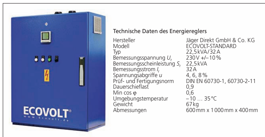
Bild 2: Energieregler vom Type Ecovolt-Standard, geprüft und gefertigt nach DIN EN 60730-1, 60730-2-11