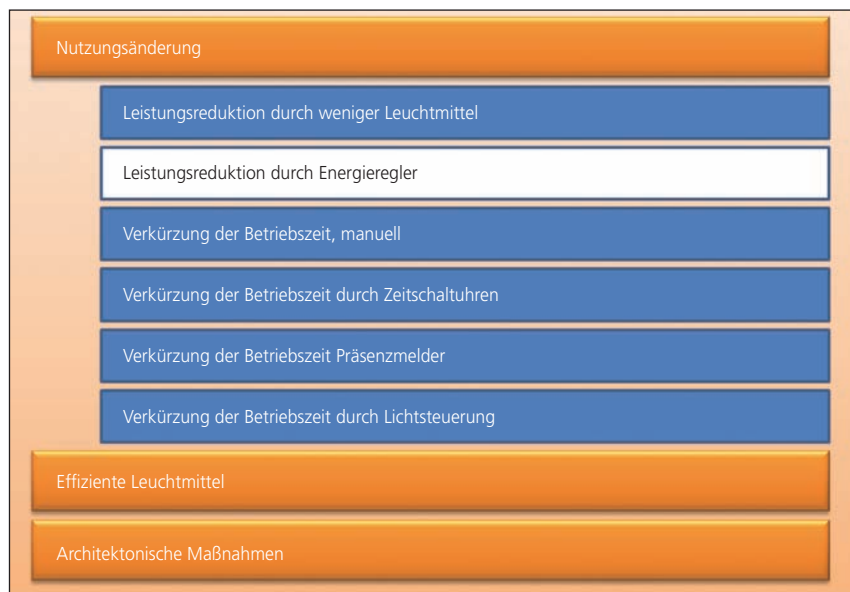
Bild 1: Maßnahmen zur Endenergieeffizienzsteigerung von Beleuchtungsanlagen

Elektrische Energieregler arbeiten nach dem Prinzip der Spannungsabsenkung innerhalb des Normbereichs. Das bedeutet, dass der Energieregler die Spannungstoleranz gemäß der IEC 60038, d. h. von 230V +6/-10% (+/-10%) ausnutzt. Der Planer solcher Anlagen muss auf die Einhaltung der Betriebsrichtli-