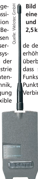
Bild 1: Das Sateline-1870E bietet eine max. Sendeleistung von 500mW und kann Distanzen von bis zu 2,5km überbrücken

de der Sendebereich auf bis zu 2,5km erhöht. Wer noch weitere Distanzen überbrücken muss, profitiert davon, dass sich mit den Modems einfache Funkstrecken mit Punkt-zu-Punkt-, Punkt-zu-Mehrpunkt- und Repeater-Verbindungen aufbauen lassen.